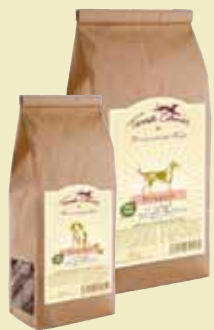
Volaille, pommes & miel

Struppis et Strolchis, les saines friandises de Terra Canis, sont cuites doucement dans le four. Outre la viande, elles contiennent des éléments nutritifs tels que l'épeautre, les épinards, les pommes, les bananes, les betteraves rouges, les baies d'aubépine, différentes herbes, du yaourt, des algues marines, de l'huile de colza, etc. Elles ne contiennent aucun additif synthétique et seul le romarin est utilisé comme conservateur naturel. Leur petite taille et leur forme pratique vous permettent de les avoir dans votre poche et de les donner comme récompense à l'école de dressage ou lors de l'entraînement quotidien. Strolchis, la version mini des Struppis, est optimal pour les chiots et les chiens de petite taille.