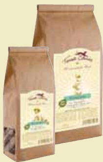
Lapin, épeautre & baies de sureau

Composants analytiques : 16,3% de protéines, 9,8% de matières grasses, 6,6% de fibres brutes, 2,5% de cendres brutes - Composition : farine d'avoine, flocons d'avoine, viande de volaille (séchée et moulue), pommes, betteraves rouges, yaourt frais, huile de colza, miel, anis, cannelle, romarin