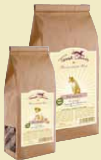
Agneau, épinards & herbes

Composants analytiques : 16,8% de protéines, 6,4% de matières grasses, 3,2% de fibres brutes, 1,8% de cendres brutes - Composition : Farine d'épeautre type 630, farine complète d'épeautre, viande de lapin (séchée et moulue), yaourt frais, baies d'aubépine, baies de sureau, fleurs d'hibiscus, zestes d'orange, huile de colza, miel, cannelle, romarin