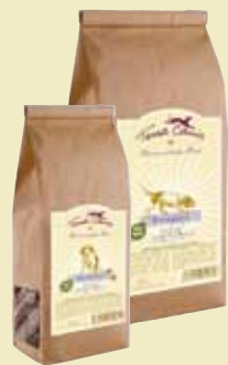
Canard, pommes & bananes

Composants analytiques : 16,8% de protéines, 6,3% de matières grasses, 3,3% de fibres brutes, 1,8% de cendres brutes - Composition : Farine d'épeautre type 630, farine complète d'épeautre, viande d'agneau (séchée et moulue), épinards, mélange légumes/herbes (céleri, fenouil, poivron, basilic, persil, ortie, ail), yaourt frais, huile de colza, parmesan, algues marines, romarin